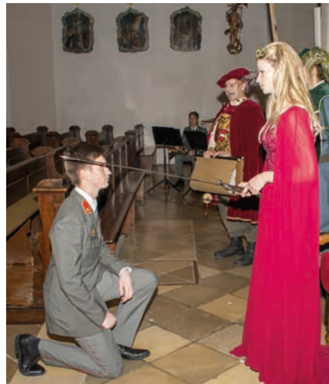
Erhebung in den Stand des Stückmeisters