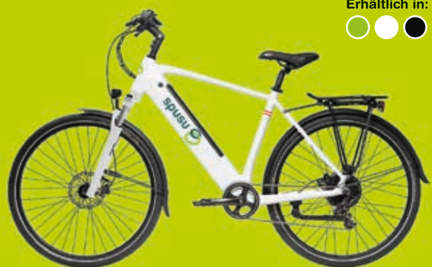
spusu E-Bike Trekking