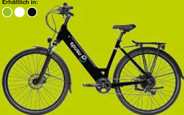
spusu E-Bike Tiefensteiger