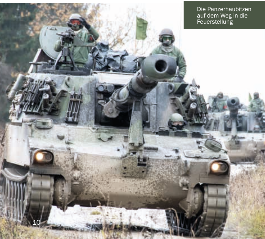
Die Panzerhaubitzen auf dem Weg in die Feuerstellung

Für die Unteroffiziere und Offiziere der Artillerie stellt die alljährliche Barbarafeier ein Zeichen der Wertschätzung und Anerkennung dar. Artillerieoffiziere werden dabei von der Heiligen Barbara durch das Barbaraschwert in den Stand der Stückmeister, Unteroffiziere in den der Büchsenmeister erhoben. Bei dieser Zeremonie soll auch die Ehrfurcht vor der Gefahr beim Hantieren mit Munition wieder ins Gedächtnis gerufen und für ein weiteres Jahr der Schutz durch die Heilige Barbara erbeten werden.