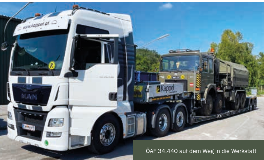
ÖAF 34.440 auf dem Weg in die Werkstatt

Bericht und Fotos: Dr. Hermann Spörker, Obmann des Traditionsverbandes