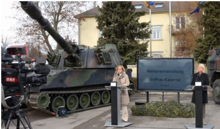
Die Frau Bundesministerin Mag. Klaudia Tanner und die Landeshauptfrau Mag. Johanna Mikl-Leitner geben den Neubau der Mistelbacher Kaserne bekannt